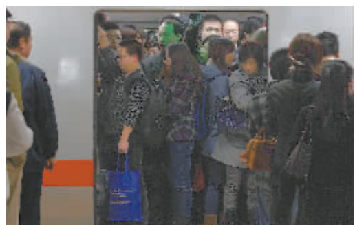
北京早高峰挤地铁的人们。目前,北京地铁日客运量达700万,仅次于莫斯科和东京。 刘航摄J214