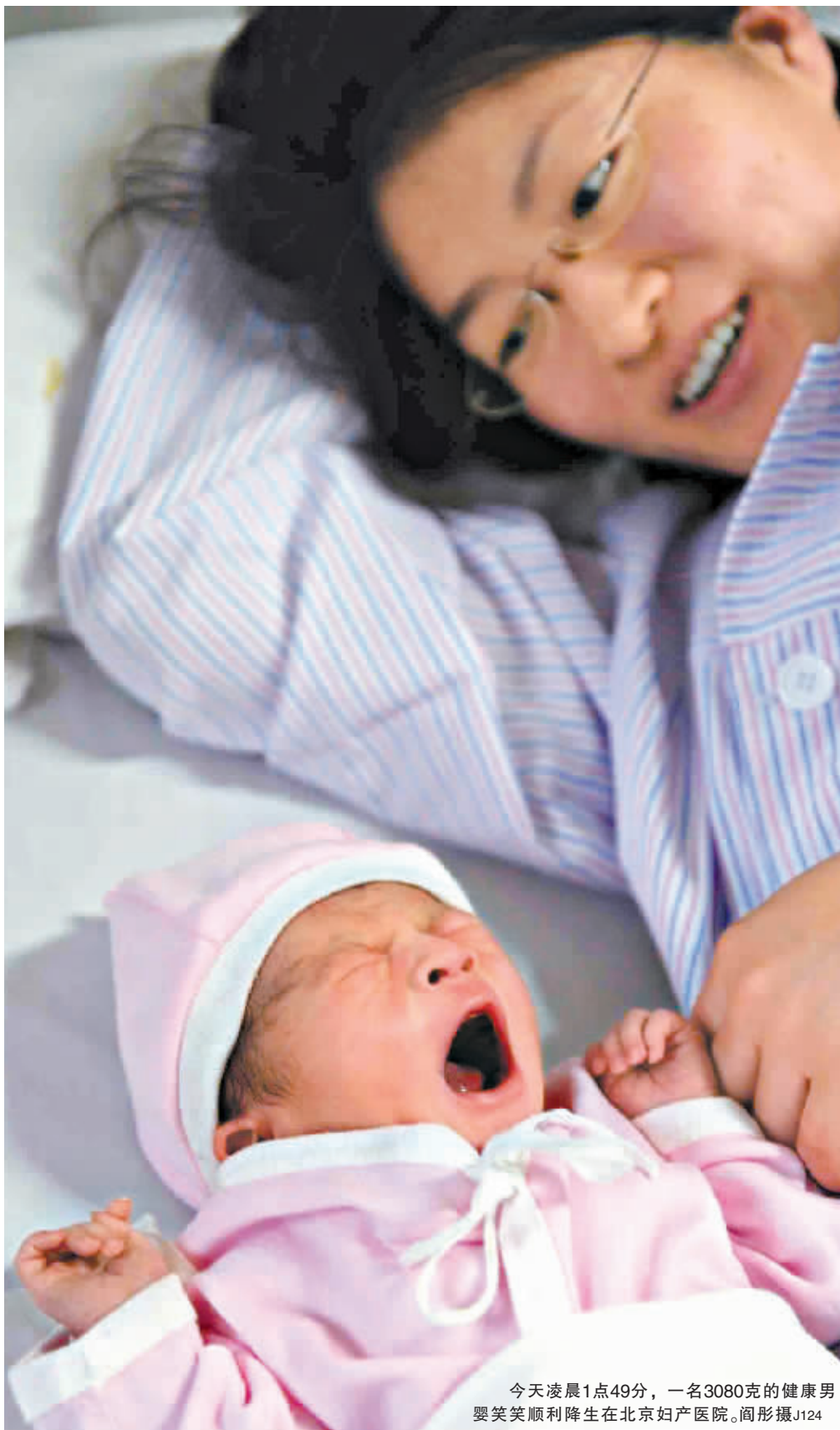
今天凌晨1点49分,一名3080克的健康男婴笑笑顺利降生在北京妇产医院。J124