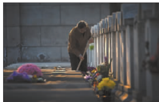
八宝山墓地,一位市民在亲人墓碑前祭奠。城市人口增长促使墓地价格高涨。 李刚摄J221