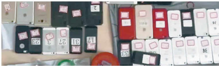
被警方收缴的骗子的手机