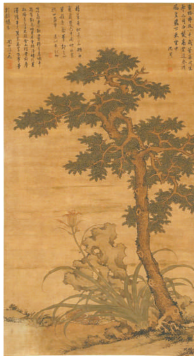
明代沈周绘《椿萱图》