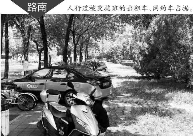
路南 人行道被交接班的出租车、网约车占据。