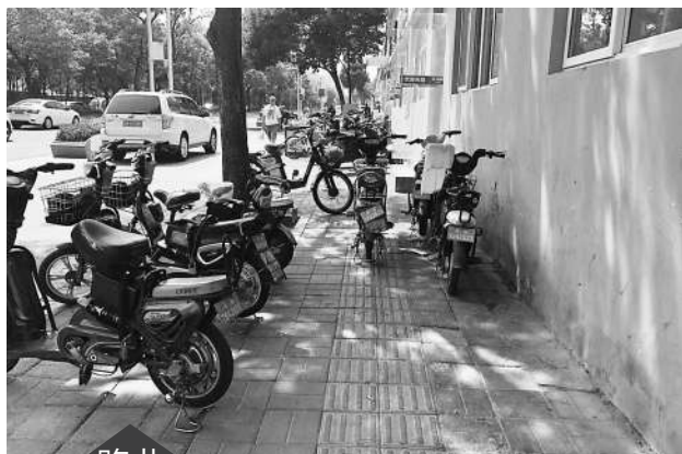
路北 人行道上停满外卖电动车。

前几天记者在这里看到,清华东路南侧是一片绿地,树荫洒在便道上。由于正值午后,吸引了很多司机来此午休,多辆出租车、网约车在便道上停放,有的司机在车上睡觉,有的则在便道上聊天。从农业大学南门到志新西路,500多米的便道绝大部分被车辆占据,来往行人只能在自行车道上行走。而有的便道上放置着隔离桶,车开不上去,于是这些车就直接停在自行车道上,不宽