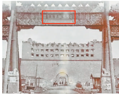
1900年之前五牌楼的匾额上,依稀可见“正阳桥”汉文在左,满文在右。

从天桥向北,经过珠市口、五牌楼,历史上还曾有一座规模宏大的石桥:正阳桥。这座石桥是明清北京城正南门正阳门外跨护城河的大石桥。这座桥自然也是中轴线上不可或缺的一部分。因为紧挨着正阳门,正阳桥当年也是非常宽阔,规模仅次于天安门外的金水桥和太和门前的内金水桥。