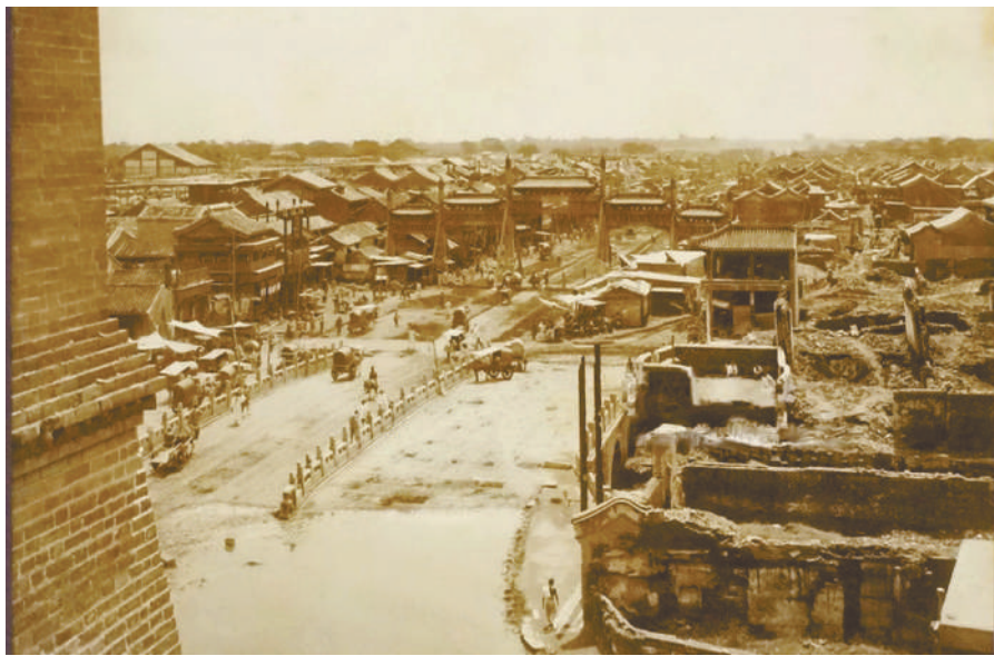
1901年日本人拍摄的前门地区,正阳桥整体格局没有大的变化。

从天桥向北,经过珠市口、五牌楼,历史上还曾有一座规模宏大的石桥:正阳桥。这座石桥是明清北京城正南门正阳门外跨护城河的大石桥。这座桥自然也是中轴线上不可或缺的一部分。因为紧挨着正阳门,正阳桥当年也是非常宽阔,规模仅次于天安门外的金水桥和太和门前的内金水桥。