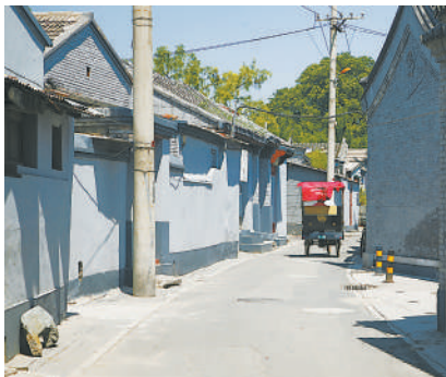
前井胡同与胡同游人力车。

尽管溥仪在前井胡同居住时间不长，很快就搬到东单附近去了，但前井胡同的一砖一瓦，一宅一门，都印着历史的痕迹。