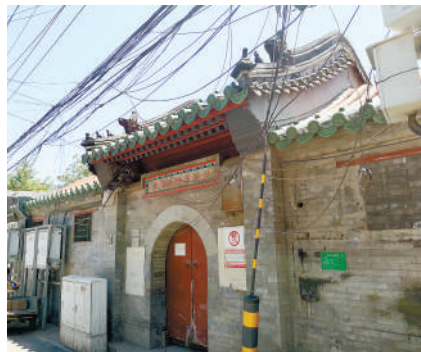
砖塔胡同关帝庙还保留着旧时的基本形态。

这座关帝庙大杂院的历史到2018年底画上了句号。目前该院已腾退完毕，修缮重建后或将作为对公众开放的文化场所。砖塔胡同这条六百余年的老胡同，也将增添新的看点。